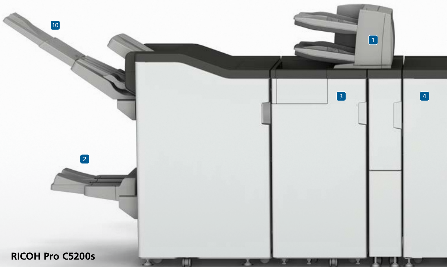
RICOH Pro C5200s